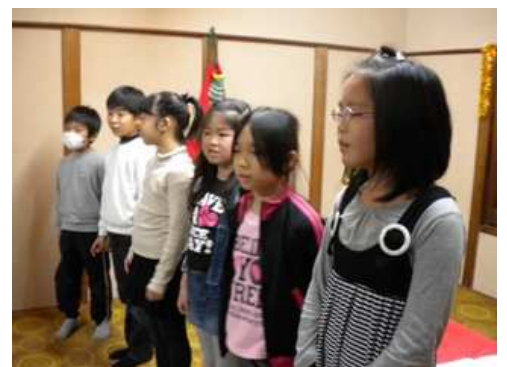
クリスマスパーティー発表の様子